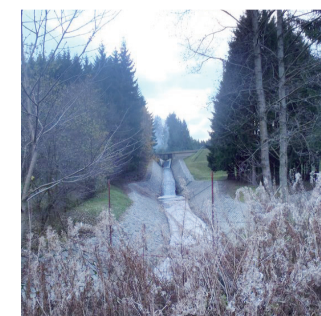
Potok Staviště je nad vstupem do města a pod přehradou sveden do kapacitního okamenovaného koryta schopného odvést i výrazně větší průtoky z lesů přes nádrž směrem k řece Sázavě.