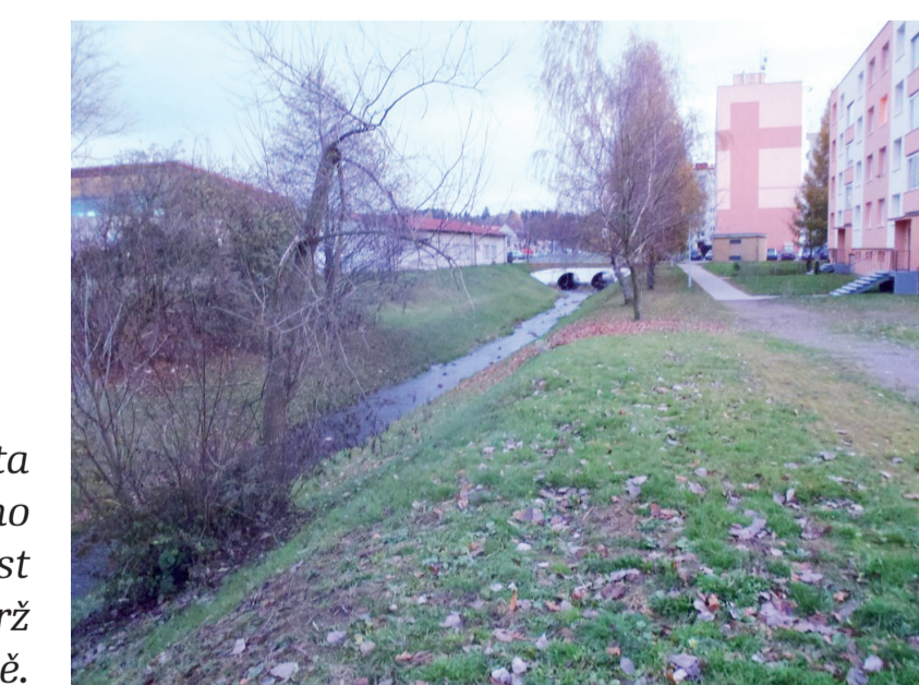
Potok Staviště je nad vstupem do města a pod přehradou sveden do kapacitního okamenovaného koryta schopného odvést i výrazně větší průtoky z lesů přes nádrž směrem k řece Sázavě.