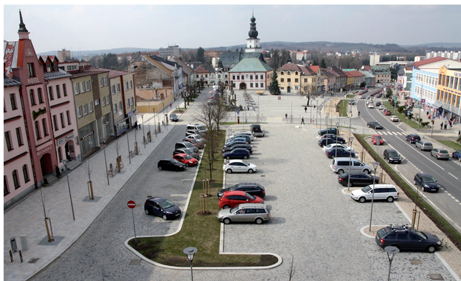
V centru města hrozí dle expertů vznik tepelných ostrovů.

21.467 obyvatel počet obyvatel klesá - Celkový úbytek obyvatel v posl. období - 202 osob 14.444 ekonomicky aktivních město stárne - průměrný věk 43 let Rozloha 37.06,37 ha